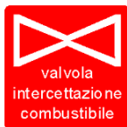
Valvola di intercettazione