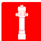
Attacco vigile del fuoco