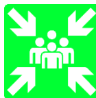
Punto di raccolta