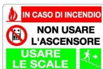
Non usare l'ascensore