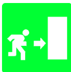
Uscita di emergenza