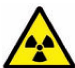
Rischio Radiazioni Ionizzanti