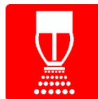
Impianto di spegnimento